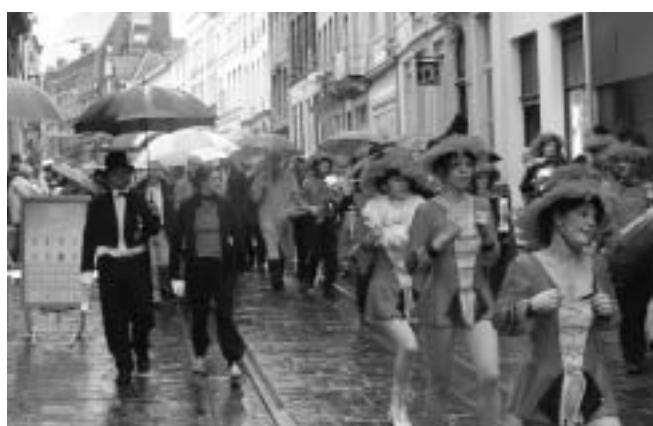
Onder begeleiding naar het diner . . .

Tijdens het jubileum uitje vertrok een gemêleerd gezelschap van 36 leden vol enthousiasme in alle vroegte vanaf het Bonkelaarplein om in de loop van de ochtend bij de rivier de Leie in België aan boord te gaan van een luxe party-boat. De vaartocht eindigde rond het middaguur in het centrum van Gent waar de groep onder leiding van ervaren Gentse gidsen diverse bezienswaardigheden in de stad bezocht en een ware lekkernijen-tocht aflegde. Einde middag uur werd de groep bij het Stadhuis ontvangen door de Gentse fanfare 'Vooruit met de kuit' alwaar per voet en onder politiebegeleiding de wandeling naar het dineradres Quartier Sauvage werd ingezet. Na zelf een forse bijdrage te hebben geleverd aan het bereiden van het diner werd rond middernacht in volle tevredenheid de terugreis aanvaard.