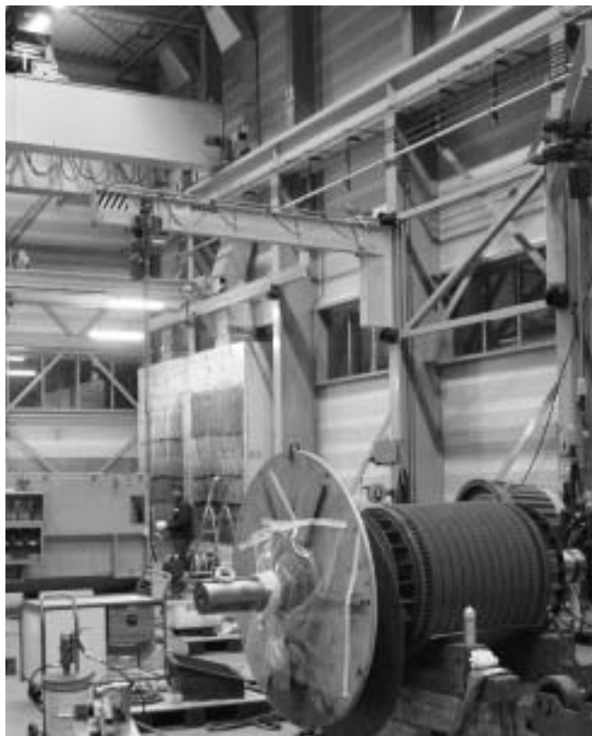
Nieuwe bedrijfshal . . .